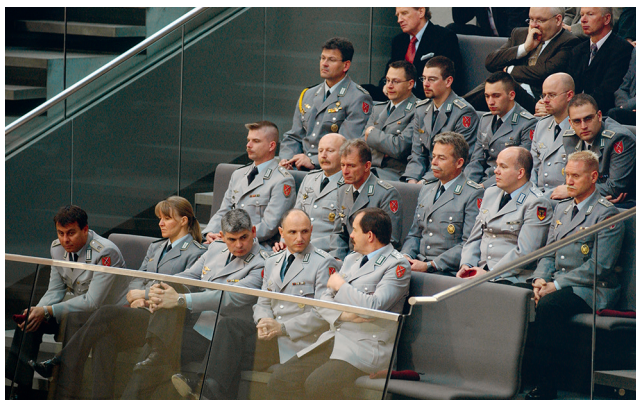
De visita en el Parlamento: miembros de la Bundeswehr en la tribuna de visitantes de la sala de plenos durante una sesión del Bundestag.

El ejercicio del control parlamentario en los sistemas democráticos presenta a veces perfiles muy dispares. En muchos casos, su consolidación solo se puede entender en su contexto histórico, y esto también es aplicable, de forma muy especial, para la República Federal de Alemania.