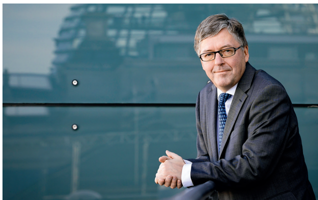
Hans-Peter Bartels, el Delegado del Bundestag para las Fuerzas Armadas

debía dar primacía al dictado de la conciencia por encima de la obediencia ciega a órdenes criminales. Justamente, porque quienes prestan servicios en nuestras Fuerzas Armadas no son personas que se limitan a recibir órdenes, sino que son mujeres y hombres que piensan con espíritu crítico; son ciudadanas y ciudadanos de uniforme. La misión del Delegado para las FF. AA. consiste en velar escrupulosamente por que la Innere Führung se mantenga firmemente arraigada en la cultura de nuestras Fuerzas Armadas, incluso se las necesite como ejército en operaciones. Este folleto presenta el cargo y las funciones del Delegado para las FF. AA. así como las personalidades que lo han desempeñado hasta la actualidad. Asimismo ofrece una síntesis de la evolución del cargo, las atribuciones y deberes del Delegado y los fundamentos legales.