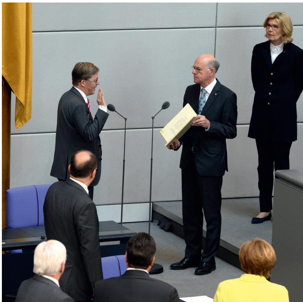
“Actuar siempre con justicia”: jura de Hans-Peter Bartels, el nuevo Delegado para las FF. AA., ante el Presidente del Bundestag Norbert Lammert (CDU/CSU, d.i.a.d.) y el Bundestag.