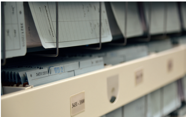
Comunicación recíproca: el Delegado para las FF. AA. y la Comisión de Peticiones se informan sobre solicitudes recibidas.

En este contexto, debe mencionarse también la Ley sobre participación de los soldados (Soldatenbeteiligungsgesetz). Este derecho de participación se articula en torno a un representante, la persona de confianza elegida en cada grupo de grado militar con el fin de que propicie la cooperación sin reservas entre superiores y subordinados y fortalezca de forma sostenible la confianza entre los compañeros.