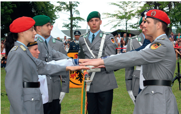
Ciudadanas y ciudadanos de uniforme: jura de la bandera de miembros de la Bundeswehr.

El significado concreto y los objetivos en la vida militar cotidiana de la Innere Führung están establecidos ante todo en diversas leyes, decretos y reglamentos. La base determinante es la Ley del Personal Militar (Soldatengesetz), que establece los derechos y obligaciones de las y los soldados y, en particular, también en su papel como superiores y subordinados. De todas maneras, la Innere Führung no se agota en la aplicación concreta de las disposiciones vigentes. En particular, esto vale para la conducta de los superiores frente a los subordinados en la vida militar cotidiana. Su liderazgo no debe regirse solamente por la letra de la ley, sino también por la buena predisposición y un sano criterio. Quienes presten servicios en las Fuerzas Armadas deben actuar como “ciudadanas y ciudadanos de uniforme”, como personas libre y responsables y estar listos para entrar en acción cuando la misión lo exija. No se les exige obediencia ciega, sino obediencia por reconocimiento de sus obligaciones.