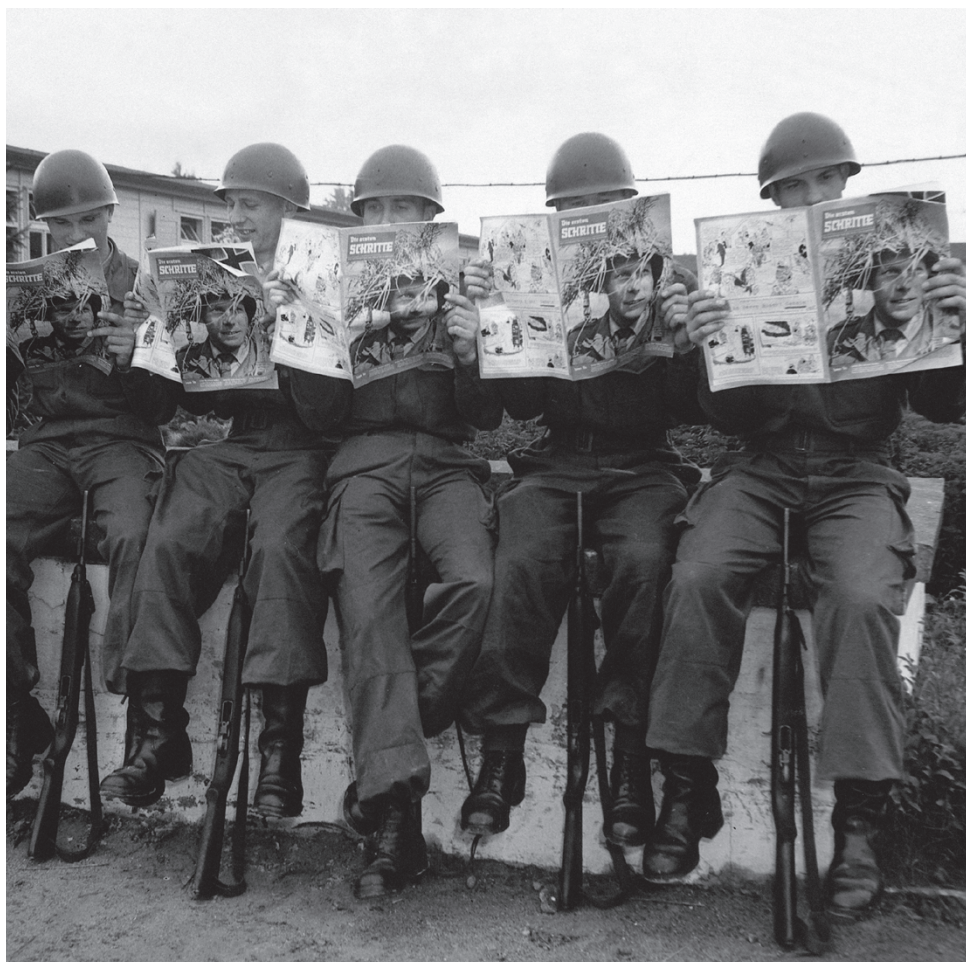
Los primeros años del ejército parlamentario: jóvenes soldados en 1953, apenas a un año de creación de la Bundeswehr, con la revista “Die Ersten Schritte” (los primeros pasos) del Ministerio Federal de Defensa.